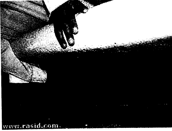
صورة توضح العلو الذي سقط منه الطفل سجاد